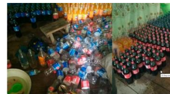
Пресс-служба В Ферганской области обнаружили подпольный цех по производству Coca-Cola и Pepsi

Узбекистан, Ташкент – ИИ Подробно.uz. В Учмурутском районе Ферганской области был обнаружен подпольный цех, где производятся контрафактные Coca-Cola, Fanta и Pepsi, сообщает корреспондент Подробно.uz со ссылкой на данные Генпрокуратуры.