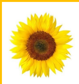
Подсолнух, как символ плодородия и самого солнца

Исходя из позиционирования и названия бренда был разработан фирменный знак, в котором объединены два символа: солнце и подсолнух в форме элементов традиционного орнамента.