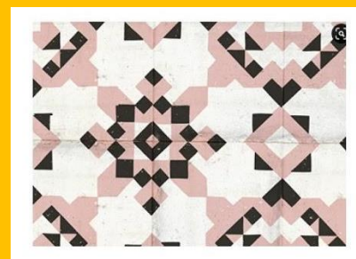
Структура композиции — элементы традиционного орнамента