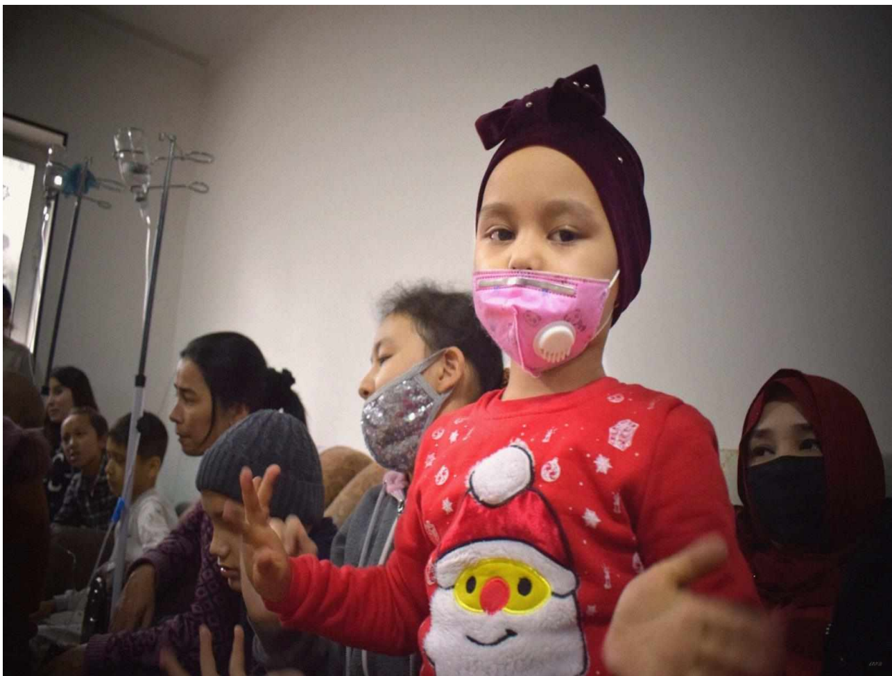
Подопечные благотворительного фонда «EZGU AMAL»

Детский хоспис сможет решить проблемы детей, которые нуждаются в паллиативном уходе. Это помощь не только ребенку, но родителям и всей семье ребенка. Детский хоспис будет бесплатно оказывать профессиональную медицинскую, социальную, психологическую помощь детям из любого региона нашей страны.