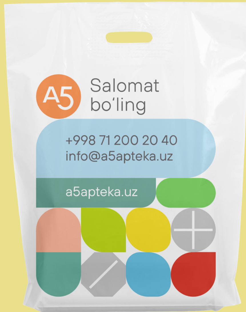
A5 Group rebranding