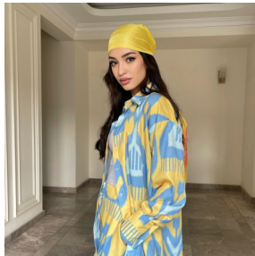
Signora by Shateni

С помощью приглашения через Instagram, было получено более 20 заявок на участие от местных брендов, что в 2 раза больше, чем возможно было принять. Поэтому, приняли участие только 8 брендов.