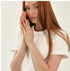
Inside by Sana