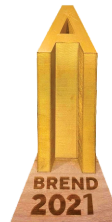
Лидер технологических инноваций среди интернет-провайдеров Узбекистана в 2021 году