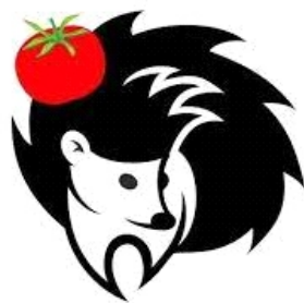
Выбор Потребитель.уз 2020