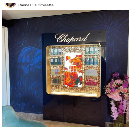
Стенды действующих партнеров Begim Parfum Gallery – Chopard и Elie Saab в Каннах