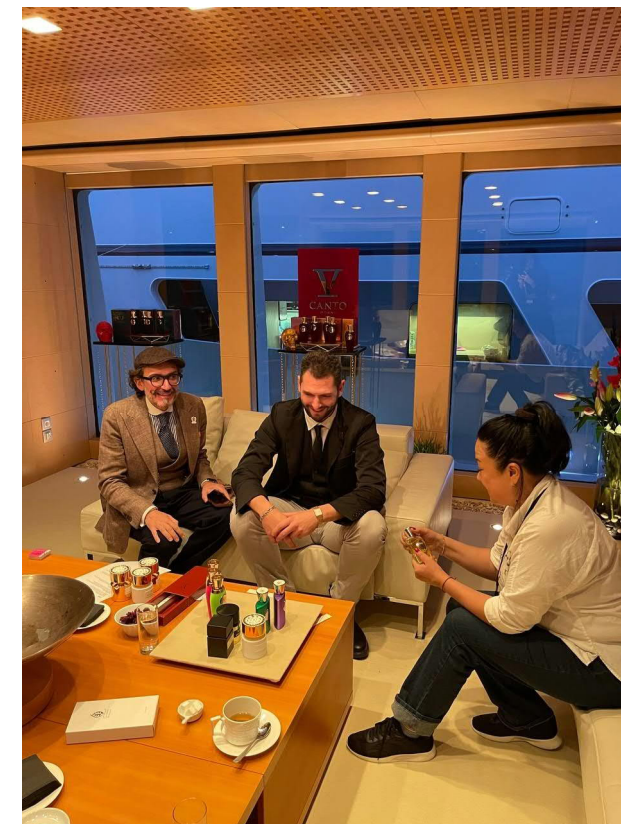
Встреча на яхте Tiziana Terenzi в Каннах