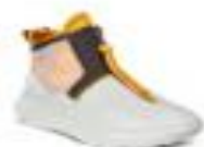
ECCO SRI LITE K 712683/56453