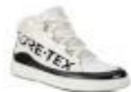
ECCO STREET TRAY K 705243/00082