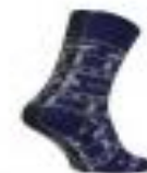
НОСКИ ВЫСОКИЕ ECCO 111627/806