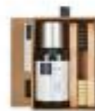
НАБОР ДЛЯ ЧИСТКИ СВЕЛОЙ ПОДОШВЫ 40101/100