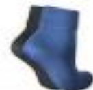
НОСКИ СРЕДНИЕ ECCO 224318/170