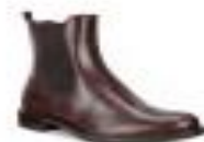
ECCO SARTORELLE 25 266502/01014