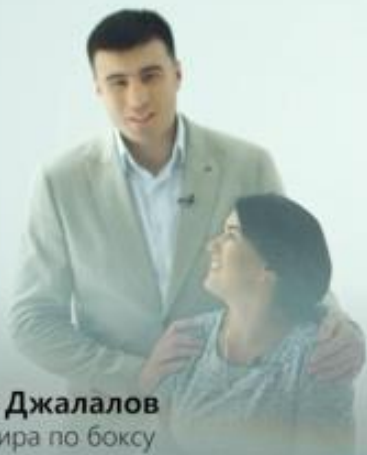
Бахадыр Джалалов Чемпион мира по боксу

Специалистами Ассоциации онкологов Узбекистана, в рамках месяца борьбы против рака молочной железы, в целях пропаганды правил здорового образа жизни, повышения осведомленности населения Узбекистана о раке и привлечения внимания к предотвращению, выявлению и лечению этого заболевания, специально подготовлен тематический социальный видеоролик, на который были привлечены звезды узбекской эстрады, артисты кино, актеры, публичные деятели, спортсмен Чемпион мира по боксу: : Гавхар Закирова, Джавохир Закиров, Нилуфар Сотиболдиева, Баходир Жалолов, Ирода Дилроз Продолжительность ролика до 60 секунд. Вышеуказанный ролик транслировался в социальных сетях.